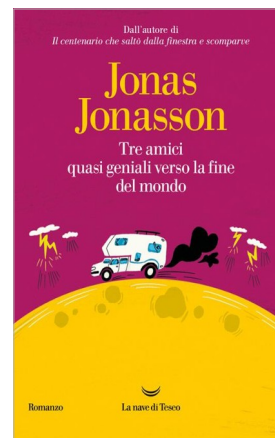
Tre amici quasi geniali verso la fine del mondo Jonas Jonasson 496 p. ; La nave di Teseo, 2023

Cono Trezza e Serenella Pinto sono due giovani del Sud, cresciuti nella zona del Vallo di Diano, tra Campania e Basilicata. Lui contadino, lei figlia di un artigiano di idee socialiste. Si sono conosciuti che erano adolescenti, aspettano solo il momento di sposarsi. Ma sono gli anni Trenta del secolo scorso, e a mettersi tra loro ci sono i fascisti. Soprattutto Romano, il figlio del podestà. Stufo di subirne l'arroganza, Cono si ribella, compiendo un gesto che la sua famiglia pagherà a caro prezzo. Poi la partenza per il servizio militare, e dopo l'8 settembre 1943 la deportazione in Germania. A tenerlo in vita, saranno la speranza di rivedere Serenella, l'aiuto di un compagno di prigionia dal cuore grande e la sua abilità nel tirare di boxe.