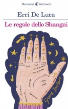
La regola dello Shangai Erri De Luca 109 p. ; Feltrinelli, 2023

È una casa fredda, quella in cui cresce Norma, in cui i genitori non si separano per quieto vivere e gli abbracci si contano sulle dita di una mano. Forse è per questo che, quando Norma è lontana dalla famiglia, tutto le sembra più bello. Come le estati passate dai nonni, a Stellata, un paesino in cui il tempo sembra essersi fermato ed è reso ancora più magico dai racconti di nonna Neve, che parlano di una famiglia di sognatori e di sensitivi e della zingara che ha segnato la loro strada.