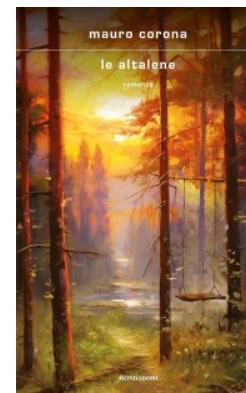
Le altalene Mauro Corona 174 p. ; Mondadori, 2023

Lei è una giovane gitana in fuga dalla famiglia per sottrarsi al matrimonio combinato con un uomo anziano, lui è un orologiaio che sta campeggiando sul confine e la accoglie nella propria tenda. L'incontro inaugura un'intesa fatta di dialoghi notturni sugli uomini e sulla vita, uno scambio di saperi e di visioni; lui che si sente un ingranaggio dentro la macchina del mondo e che quel mondo interpreta secondo le regole dello Shangai, come se giocare fosse un modo per mettere ordine nel caos. Un'intesa che durerà a lungo, anche da lontano, e finirà per modificare l'esistenza di entrambi: uno scarto nel gioco, un bastoncino che si muove.