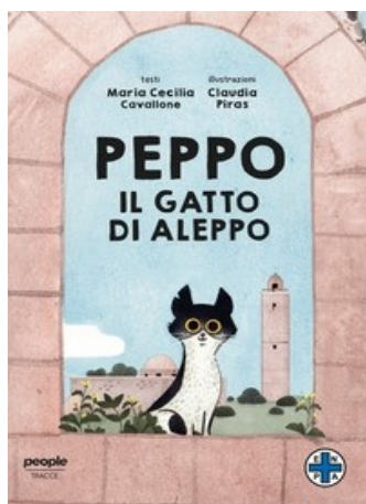
Peppo il gatto di Aleppo Maria Cecilia Cavallone People