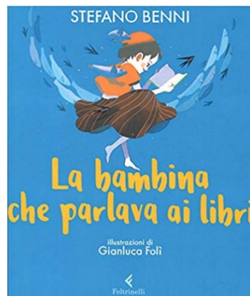
La bambina che parlava ai libri Stefano Benni Feltrinelli